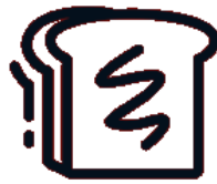
Ogi guria, plastikopean