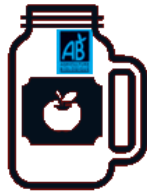
Sagar jusa biologikoa