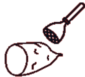
Etxeko patata gozo purea