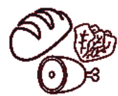
Ogitartekoa bertako xingararekin