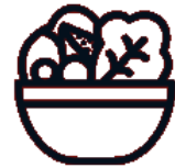
Etxeko entsalada eta sasoineko barazkiak