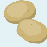
Pomme de terre