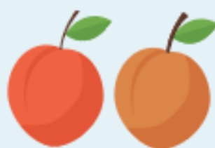
Nectarine & Pêche